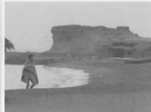
ישראל בסיני, צילום ארכיון אלי דסה

המטה ללוחמה בטרור החריף היום (ב') את אזהרת המסע החמורה ממילא לנטיעה לחצי האי סיני, וקורא לכל הישראלים הנפשים או מבקרים במקום לשוב לישראל במהירות האפשרית. במטה הדגישו כי מדובר באיום קונקרטי חמור מאד. "אימי הטרור בסיני הולכים ומחריפים, וכעת מעל לכולם נחשף איום קונקרטי מידי וחמור של חטיפת ישראלים מחופי סיני והברחתם לרצועת עזה", נכתב בהודעת המטה.