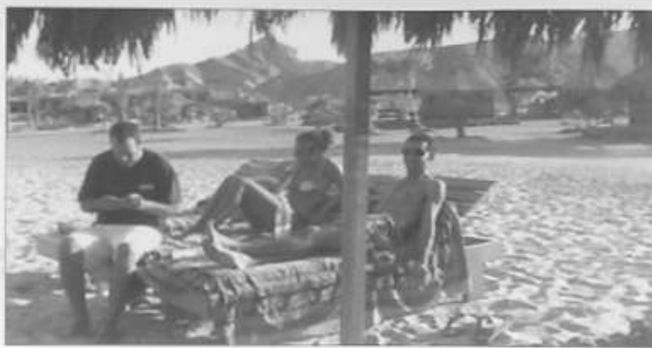
איור 6: "ישראלים בסיני"

שמטילות ספק (חופים "אסורים") ולהרפתקה שמוזמנת לעיתונאית, שכנראה אינה חוששת כלל מ"האזהרה המפורשת". כמו בדוגמאות הקודמות, גם באיור 6 מדובר בצילום אילוסטרציה, אך כזה שצולם במקום ממש, ואף נגזר מסרטון וידאו. כך שמדובר במעין חיקוי לצילום חובבים, שכפי שטענו, מציע את הדימוי השגרתי המצופה, מרוחק פעמיים מהקשר האימה.