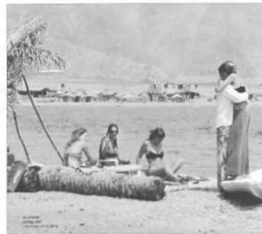
איור 2: "ישראלים על החוף בנואיבה"

משום שהצילומים הם סמליים, ברובם מופיעים אנשים שאינם מזוהים בשמם אלא בכך שהם "נופשים משלנו". כך מוצגים במרחבים המתווכים על ידי כתבות האזהרה דמויות שהן אנונימיות ובעלות זהות בו בזמן: ברמה האינדיווידואלית (שמית) – הן אנונימיות, אולם ברמה המגדירה אותם כמשתתפים בעיסוק התיירותי – הן מזוהות