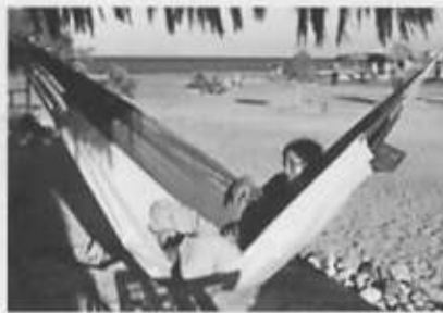
ישראלית בסיני. האיום בחצי האי מוגדר "קונקרטי וחמור במיוחד"

המטה ללוחמה בטרור מזהיר כי לגבי קניה קיים "איום טרור קונקרטי בסיני"; בנגלדש וניגריה "איום פוטנציאלי מתמשך"